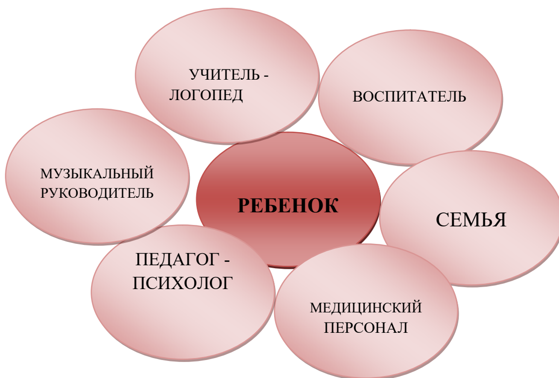
Схема «Единого коррекционно-образовательного пространства для ребенка с речевыми нарушениями»:

Как уже ранее замечено, психо-речевые особенности в развитии детей с тяжелыми нарушениями речи спонтанно не преодолеваются. Они требуют от педагогов специально организованной коррекционной работы. С этой целью в МБДОУ №95 сформировано единое коррекционно-образовательное пространство для детей с речевыми нарушениями.