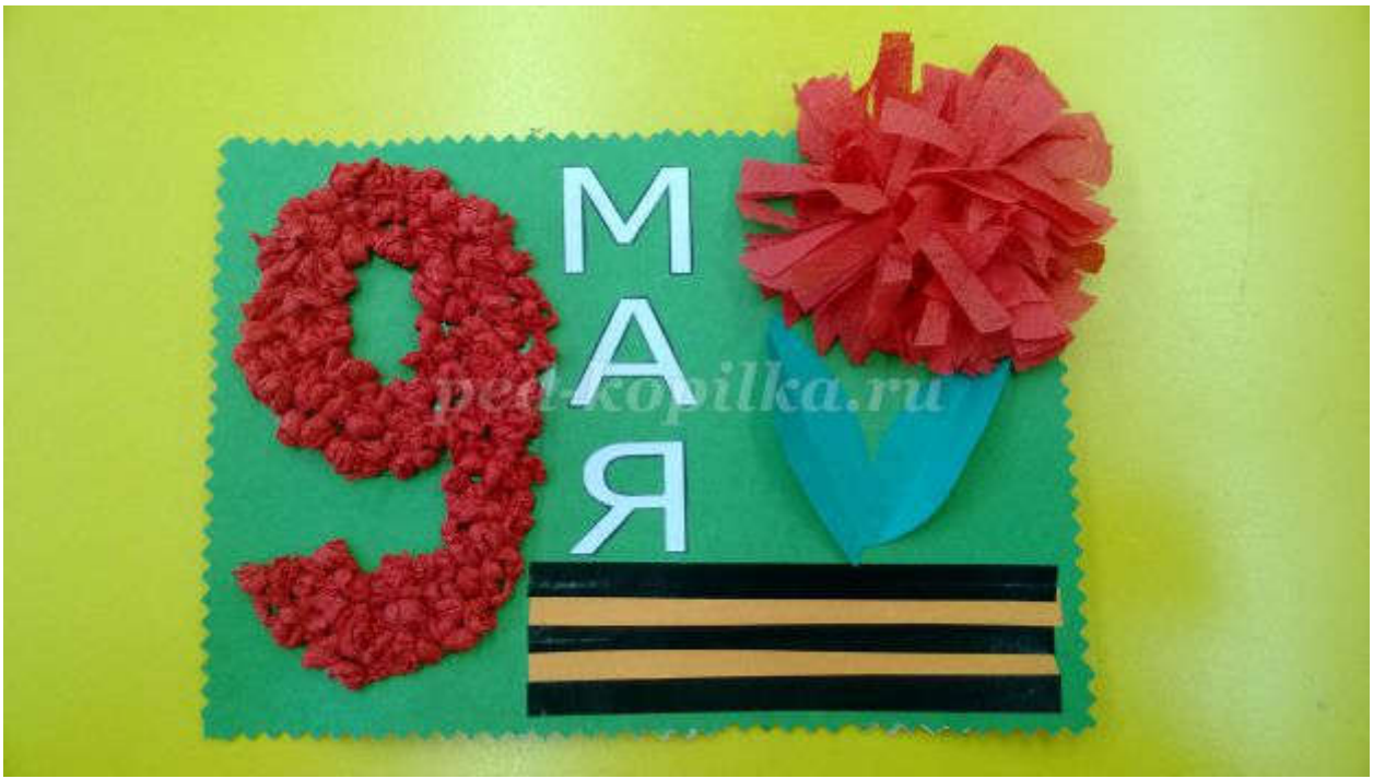
23. Наша открытка ко Дню Победы готова.